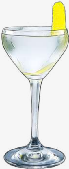
Dry Martini l'Original (1904)